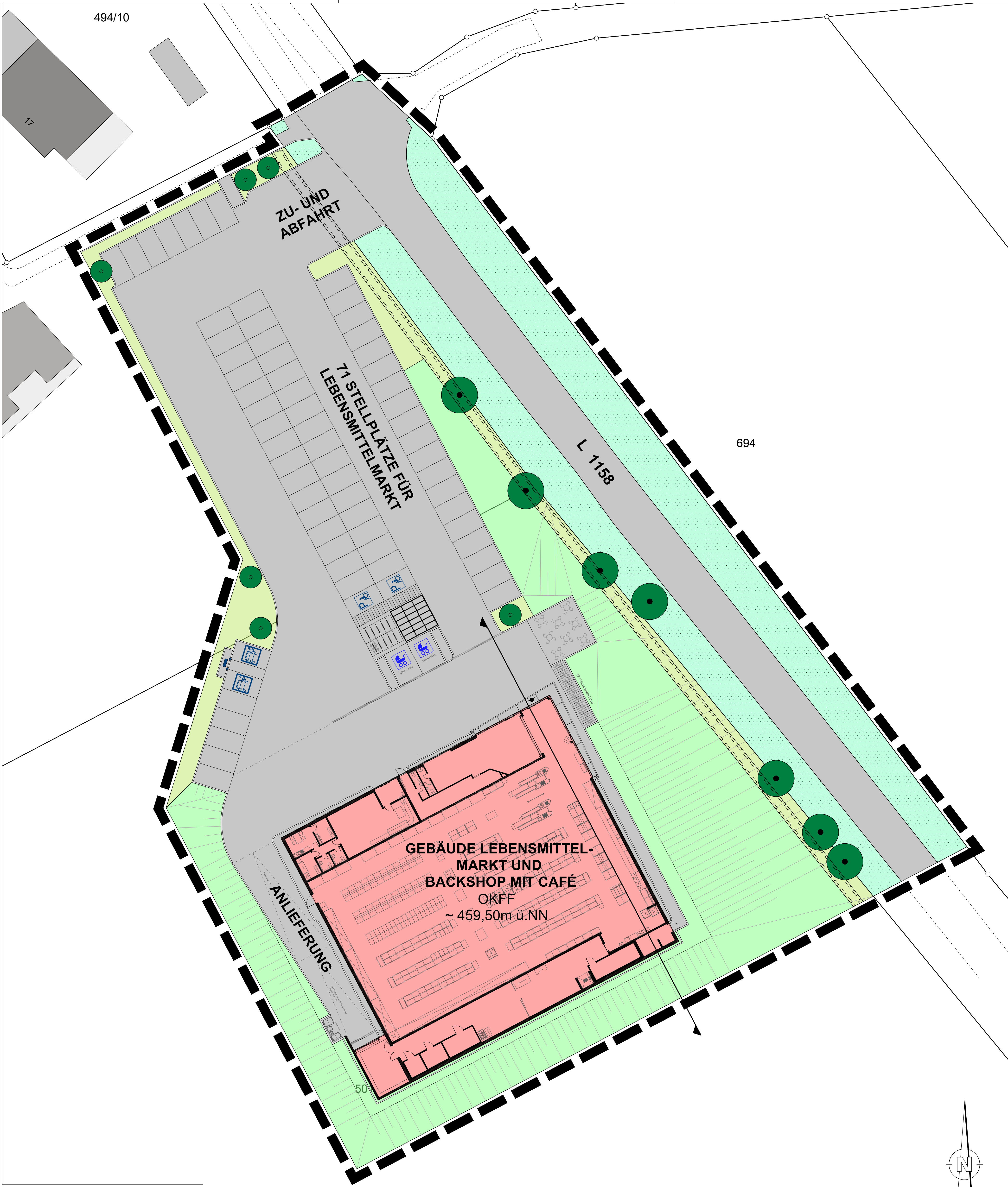
LAGEPLAN Maßstab 1:250